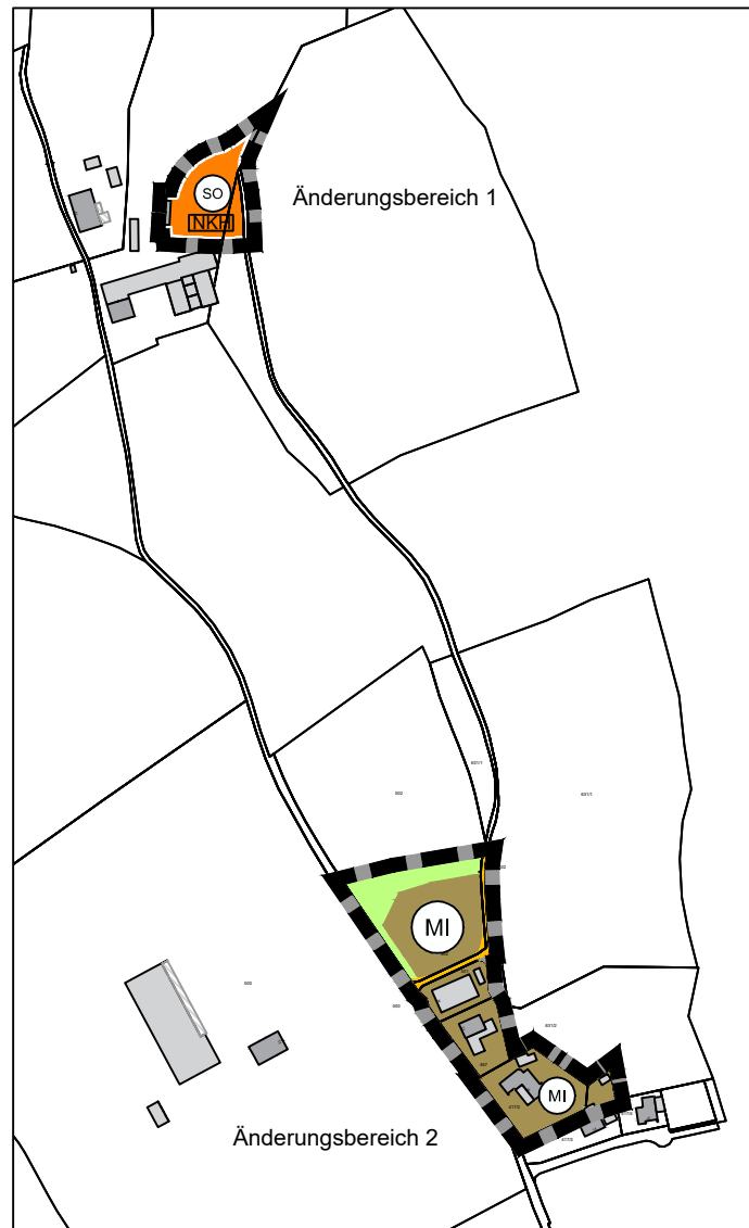
Änderungsplan M 1: 5.000